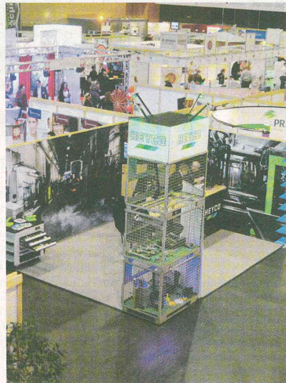
Der neue Messestand von HEYCO wurde eigens von Mitarbeitern konzipiert und mitangefertigt.

Verfahrensmechaniker für Kunststoff und Kautschuk (m/w) Ausbildungsdauer 3 Jahre